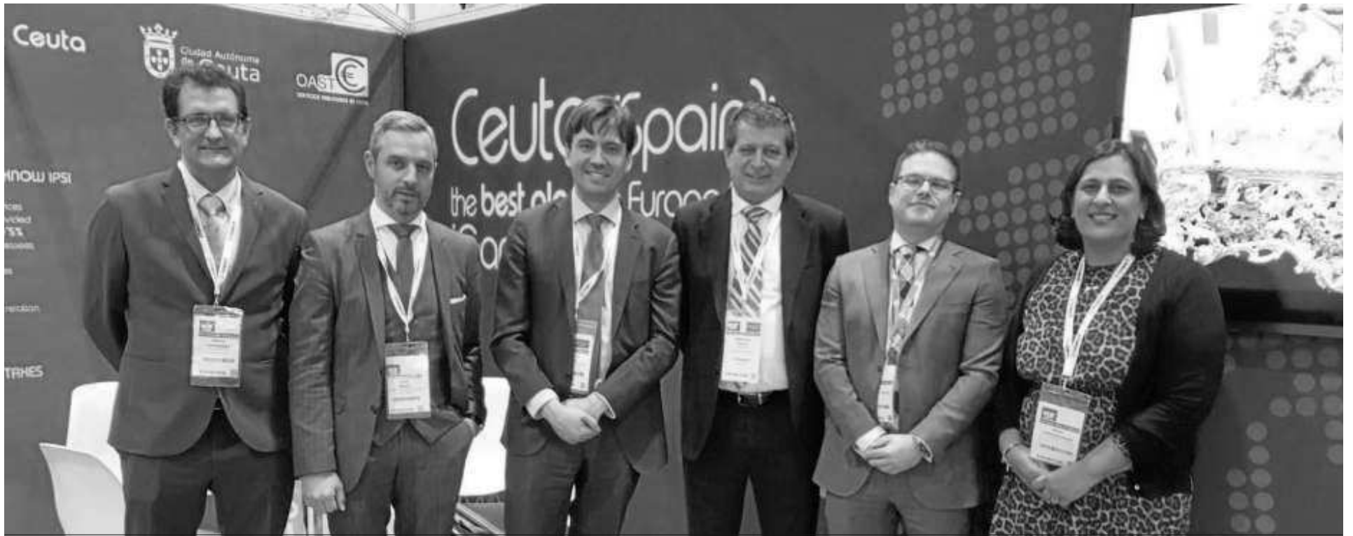
El Gobierno ceutí ha estado presente en numerosas ferias a lo largo de los últimos meses.