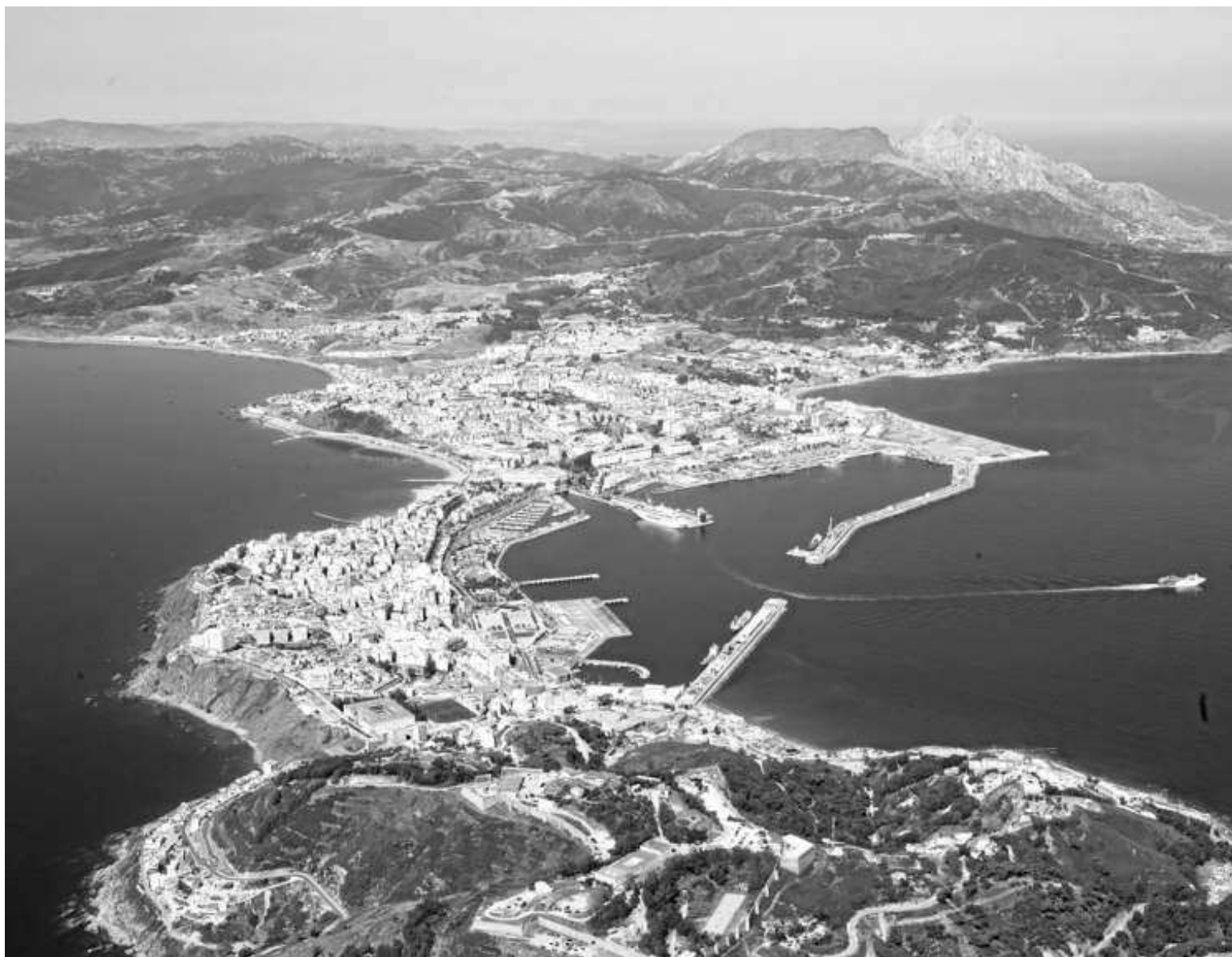
Las ayudas de la inversión pueden llegar hasta el 35% del proyecto