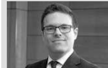
Juan Espinosa DIRECTOR GENERAL DE ORDENACIÓN DEL JUEGO