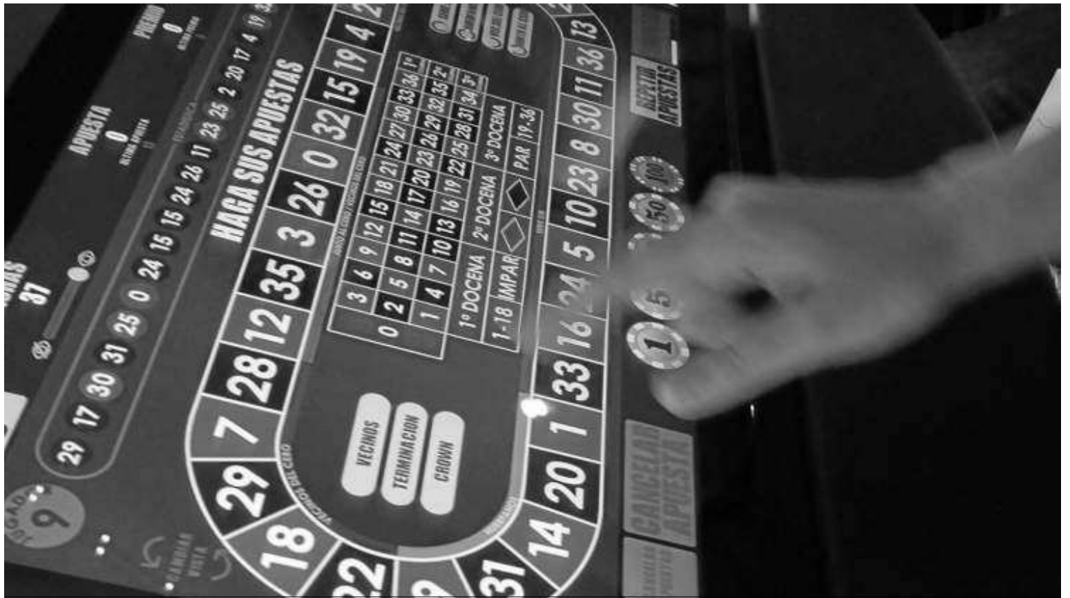
La regulación del juego es competencia de la Dirección General.

Un aspecto esencial es buscar la mayor seguridad en esas apuestas. En la actualidad, en relación a la seguridad del entorno de juego, “y estando razonablemente satisfechos con la actividad desplegada en la lu-