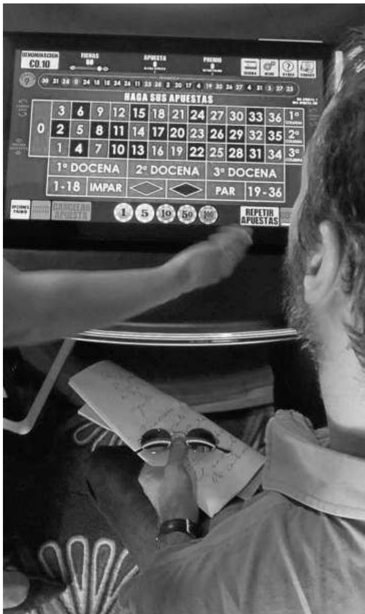
El objetivo es dar a conocer la realidad de nuestra ciudad.

El objetivo de la Ciudad, tal y como se manifestó en multitud de ocasiones por parte del presidente Vivas es convertir a Ceuta en un centro tecnológico