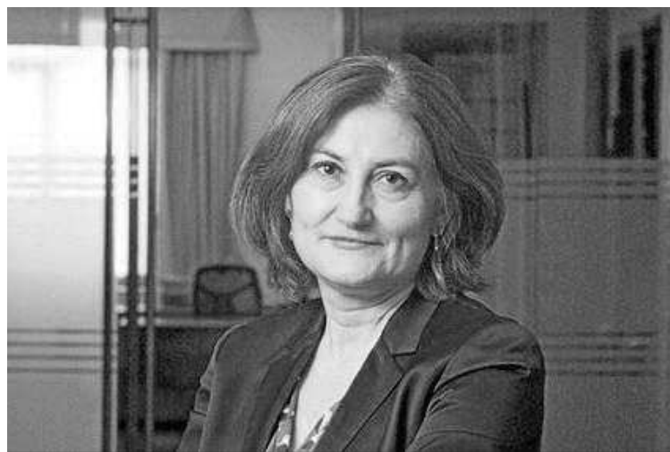
La directora general de Tributos estará presente en las jornadas.